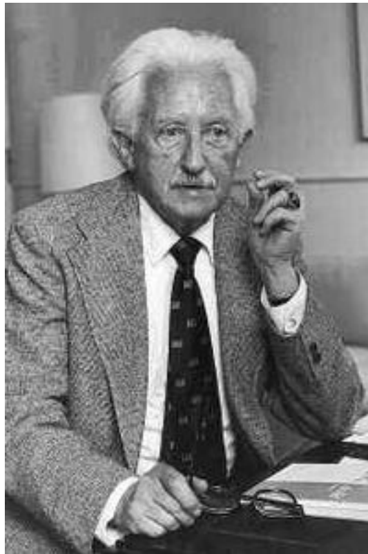
Fig. 10. Erik Erikson.

Considera que las etapas son interdependientes: los logros en las etapas tardías dependen de cómo se hayan resuelto los conflictos durante los primeros años, al igual que plantea la teoría de Freud. También indica que en cada etapa el individuo enfrenta una crisis del desarrollo, un conflicto entre una alternativa positiva y una alternativa potencialmente dañina. La manera en que la persona resuelve cada crisis tendrá un efecto perdurable en su autoimagen y en su perspectiva de la sociedad.