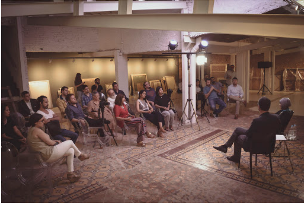
Fig.1. Fundación Texo para el arte contemporáneo. Fuente: http://innova.news