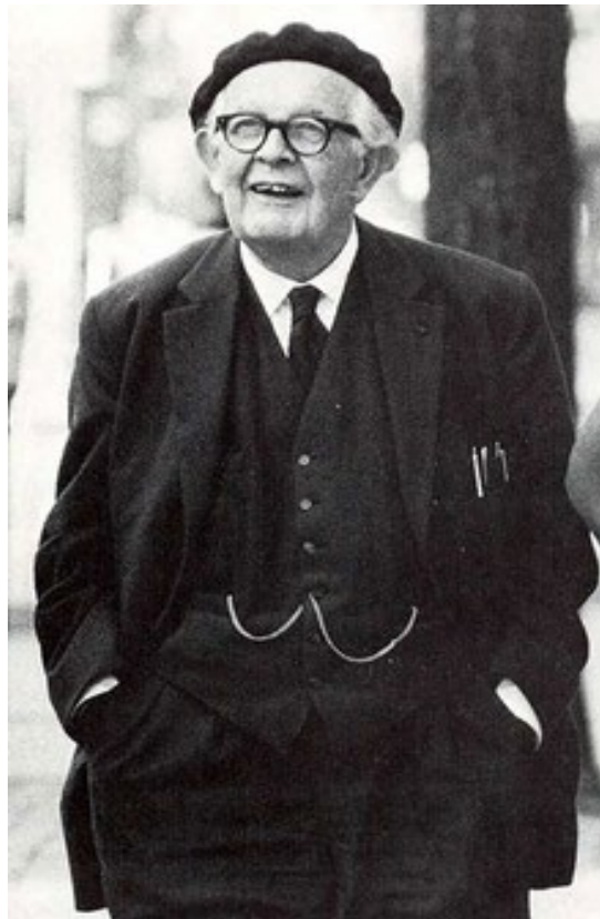
Fig. 8. Jean Piaget.

Mediante nos vamos desarrollando interactuamos con las personas quiénes nos rodean. De esta manera nuestro desarrollo cognoscitivo se ve influenciado por el contacto social, entonces, aprendemos de los demás. Si eso no ocurriera, sería urgente la reconstrucción de conocimientos que obtenemos gracias a nuestra cultura. El conjunto de informaciones que las personas aprenden de la transmisión social varía de acuerdo con la etapa del desarrollo cognoscitivo en que se encuentren. Tanto la maduración como la actividad y la transmisión social funcionan de manera conjunta para afectar el desarrollo cognoscitivo.