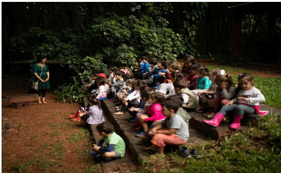
Fig. 7. Kunumi Arete.

¿Cómo estamos enseñando? ¿Cómo se sienten nuestros niños y niñas frente a lo que hacemos con ellos/as en el acto de enseñar? ¿Qué podemos hacer diferente para que ellos y ellas sean más felices en la escuela? ¿Para que aprendan matemáticas? ¿Para que aprendan a leer y escribir? ¿Para que expresen su propia voz?