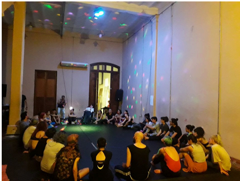
Fig.3. Espacio E.