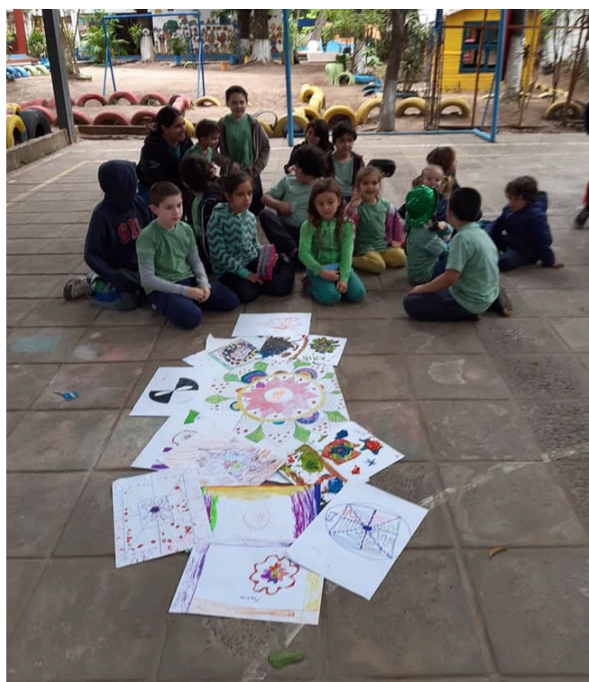
Fig. 6. TEIJ.