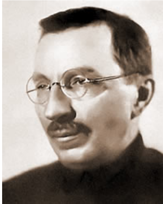
Fig. 14. Anton Makarenko.