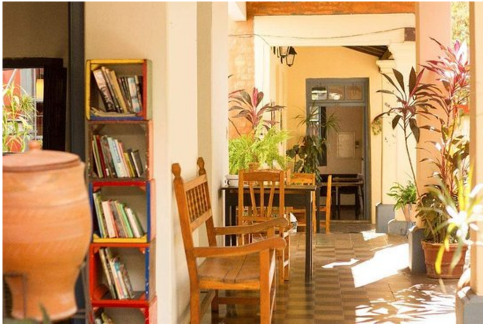
Fig.2. El Granel.