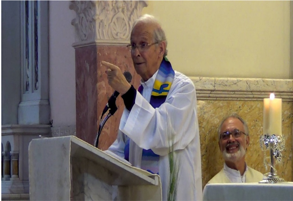
Fig. 13. Alejandro Cussianovich.