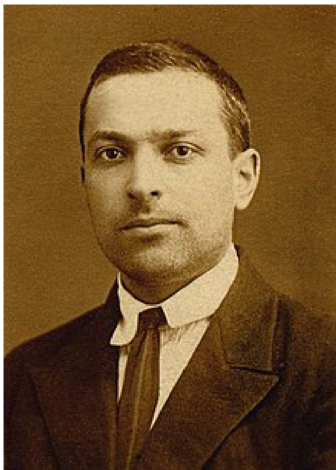
Fig. 11. Lev Vygotsky.

Una de sus principales ideas fue que nuestras estructuras y procesos mentales específicos pueden rastrearse en nuestras interacciones con los demás. Estas interacciones sociales son algo más que simples influencias en el desarrollo cognoscitivo, ya que en realidad crean nuestras estructuras cognoscitivas y procesos de pensamiento, así lo define Palincsar, 1998.